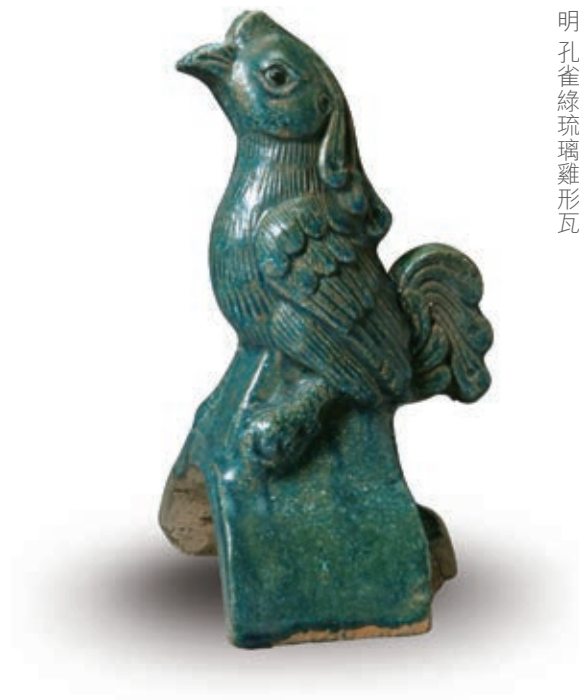
明孔雀綠琉璃雞形瓦

本公司將繼續因應其業務活動及增長改善其企業管治常規，並不時審閱該等常規以確保其遵守企業管治守則及配合最新發展。