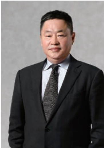
遠東宏信有限公司 董事局主席 寧高寧