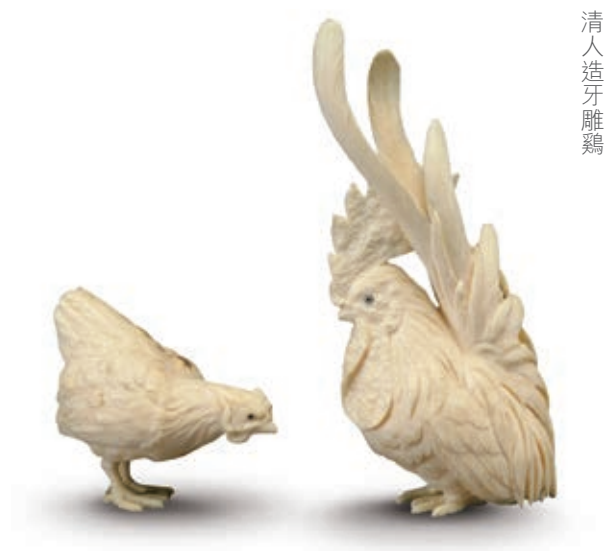
清人 造牙 雕雞

從本集團所附著的各產業板塊來看，產業環境分化趨勢日趨明顯。醫療、教育、城市公用、信息傳媒產業保持了較為穩定、快速發展的勢頭；中國建築業逐步進入產能飽和期，產值增速減緩，但新型城鎮化、基礎設施升級與完善將為建築業創造新增量空間；工業裝備、輕紡、交通、包裝行業受經濟增長放緩影響，行業仍將處於調整、震蕩與升級過程中。