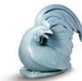
清乾隆 粉青釉鷄形熏

二零一六年度，本集團依託於中國實體經濟，繼續秉承「金融+產業」的經營理念，整體業績呈健康穩定增長，實現除稅前溢利4,072,470人民幣千元，較上年度增長13.76%；本公司普通股持有人應佔期內溢利2,882,208人民幣千元，較上年同期增長15.15%，與截至二零一五年度比較數字如下表所示。