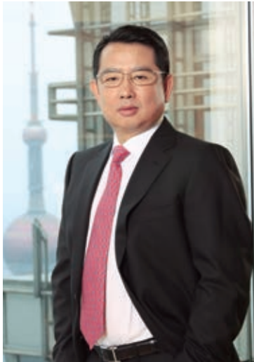
遠東宏信有限公司 董事局副主席及行政總裁