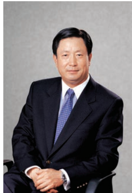
遠東宏信有限公司 董事局主席 劉德樹

截至二零一四年末，本集團總資產突破1100億元人民幣，較年初增長約28%；全年實現歸屬於普通股持有人淨利潤22.96億元人民幣，同比增長約20%。同時，本集團資產質量依然保持穩定，撥備覆蓋率保持在近220%，有效實現了本集團安全、穩健的發展目標。這一成績的取得離不開各位股東、合作伙伴長期以來的大力支持，也離不開管理層和全體員工的辛勤工作，本人謹代表董事局全體董事對此表示衷心的感謝。