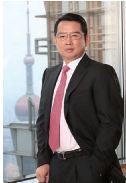
遠東宏信有限公司 董事局副主席及行政總裁

截至2014年12月31日，本集團總資產規模達到1107億元人民幣，較去年同期增長28%；全年實現歸屬於普通股持有人淨利潤22.96億元人民幣，較上年同比增長約20%。在資產總量持續擴大，確保盈利規模穩步增長的同時，資產質量保持相對穩定，不良貸款率為0.91%，撥備覆蓋率繼續保持218.7%的穩健水平，進一步增強了公司抵禦風險的能力。